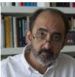
Daniel Innerarity Grau