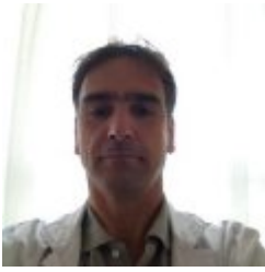
Javier Alaba Trueba