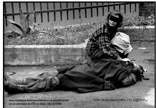
Una ciudadana anónima atiende a un policía herido en un atentado de ETA en Eibar, 18/12/1988