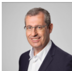
Markel Olano Arrese

Diputación Foral de Gipuzkoa, Diputado General