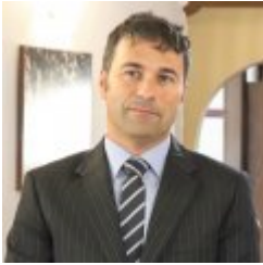
Unai Andueza Iraeta

Gipuzkoako Foru Aldundia / Diputación Foral de Gipuzkoa, Director General de Proyectos Estratégicos