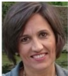
Arantza Beitia Ruiz de Mendarozqueta