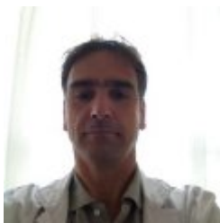
Javier Alaba Trueba