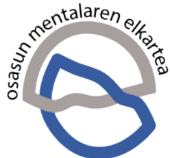
Asociación de Salud Mental y Psiquiatría Comunitaria