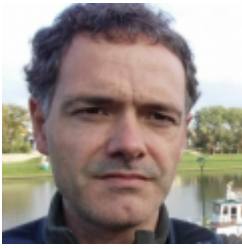
Unax Lertxundi Etxebarria